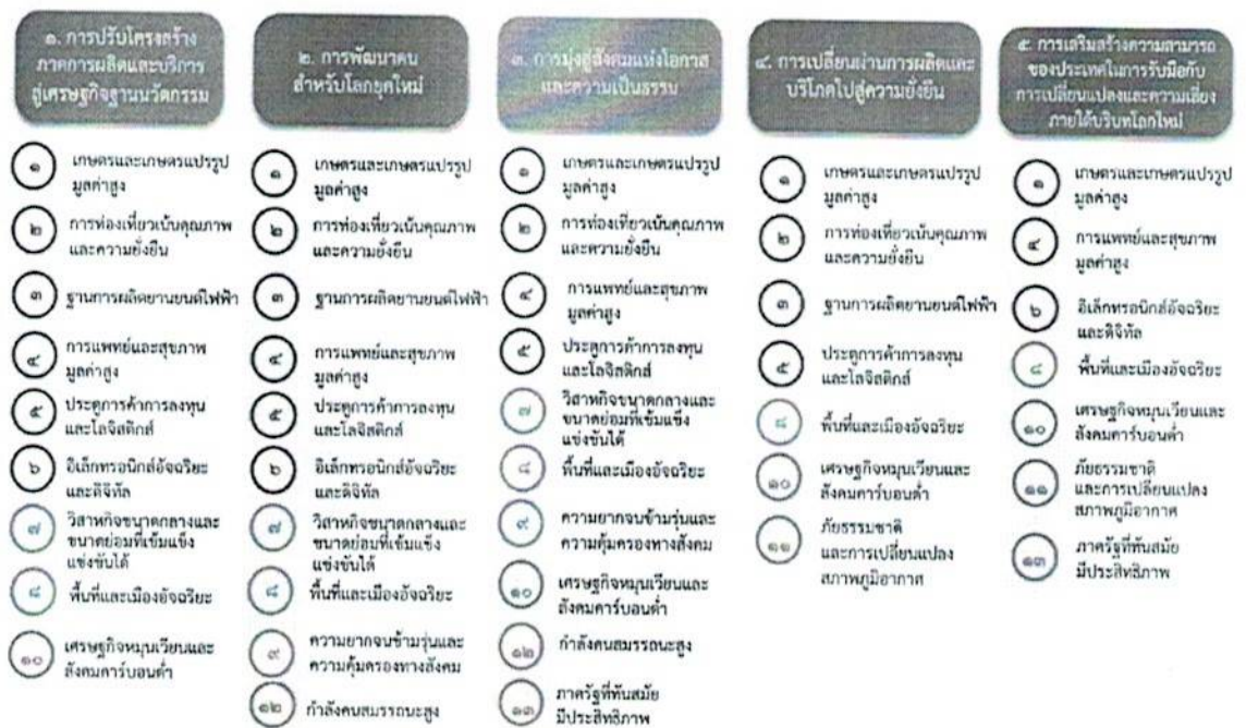
แผนภาพที่ ๓.๑ ความเชื่อมโยงระหว่างหมุดหมายการพัฒนากับเป้าหมายหลัก